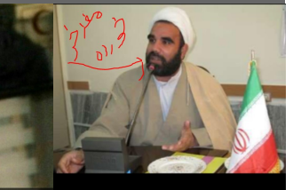
روحانیون ایران (علی محمد الوارادان): خداوند از زمین لرزه برای مجازات کردها استفاده کرد؛ زیرا آنها برای همه استقلال کورستان برگزار کردند. حماقت هیچ محدودیتی ندارد...

اعترافات یکم مقام دلسوز نظام نماینده کرمانشاه "بیش از ۱۰۰۰ نفر جان باخته اند / اینجا قیامت است / صداوسیما به کرمانشاه خیانت کرد / هلال احمر بسیار بی نظم و تدبیر است"