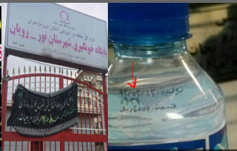
عکس یکی از آب معدنی های آرسالی تو هلال احمر کرمانشاه تاریخ تولیدش سال ۱۹۲ اینابی رو هم که مسکن مهر نگاشته با اینا میخوریم یکسید!

فوری تال و خسر ۱۲ اساله لایتنر را در زلزله از دست داده جهت دریافت ششگان به فراگاه سپاه نبی اکرم کرمانشاه در پم مراجعه می کند و سرنگ محمد موسوی در پوشا جیبش به همراه انگه و دو ساعت در امام رضا کرمانشاه بسوی هستند. کلال را به بیان فراموشی سوزن نخاب می برد و به کتد. باوقه کلال به سپاه نبی اکرم کرمانشاه مراجعه می کنند و می گویند کلال اسم او را روی انکت نظامی شان خوانده و میسازد. می نامد و به او میسازد. میسازد که چنین تخریب حوزه علمیه، سوزن لایتنر / اقتصاد آنلاین