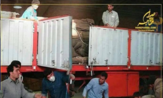
نه خود محتاج کمکنند اما کمکهایشان را از مردم حادثه کرمانشاه دریغ نکردند