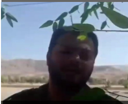
سخنان خلبان هوانیروز ارتش: آن چیزی که در صداوسیما گفته میشه واقعیت نیست و عمق فاجعه بسیار وسیعتر از آن چیزی است که در صداوسیما و فضای مجازی، منتشر میکنند! مردم بیدار! شده اند!