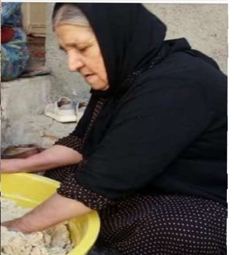
دایه سلطنه مادر فرزاد کمانگر سرگرم نان و کولیچه درست کردن برای آسیب دیدگان زلزله