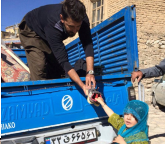
این روزها بچه های این دیار زخمی درسهای انسانیت می دهند جمع آوری کمکهای مردمی مردم روستای کاشتر بخترجه ای که کفشهای خود را برای کمک به مردم زلزله زده فرستاد