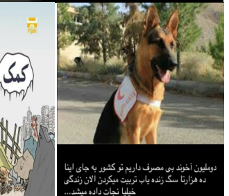
دولتیون اخوند بی مصرف داریم تو کشور به جای اینا ده هزاره سگ زنده یاب تربیت میکنن الان زندگی خیلیا نجات داده میشه...

نیروهای ضدشورش در کرمانشاه، سرپل ذهاب، روستای حبیبوند مستقر شده اند. امنیتی کردن برخی مناطق زلزله زده با چه هدفی صورت می گیرد؟ جلوگیری از حضور خبرنگاران خارجی؟ گروههای مستقل مردمی امداد رسانی؟ مقابله با انفجار خواندگیخته خشم مردم از ناکارایی مدیریت بحران؟ حفاظت روحانی و هیئت رهبر؟ همه با همه؟ ارسال کرده!