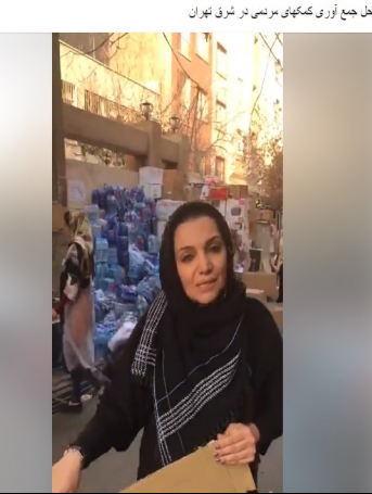
محل جمع آوری کمکهای مردمی در شرق تهران