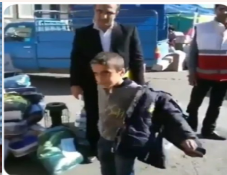
پسر بچه ای در سندج که کاپشن خود را از تن در آورد و تقدیم به زلزله زدگان کرمانشاه کرد