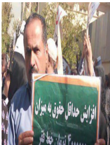
خط فقر چهار میلیون تومان است!

امسال فریاد بلند کارگران بیشتر از هر زمان دیگری گوش‌های سنگین مسئولان را به لرزه درآورد است. اعتصاب و اعتراض کارگران باید منجر به زندگی با رفاه بیشتر در این جامعه برای کارگران شود، این درد دل‌های زخم دیده‌ایست که دیگر نمی‌خواهند با فقر، بی‌عدالتی، تبعیض و نابرابری دست و پنجه نرم کنند.