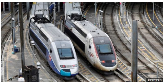
اعتصاب گسترده خدمه راه آهن دولتی در فرانسه، شبکه ریلی این کشور را دچار اختلال کرده است.

اعتصابکنندگان خواستار شش درصد اضافه حقوق هستند و دو دوره مذاکره سندیکای کارگری "وردی" آلمان با کارفرمایان تاکنون بی نتیجه بوده است.