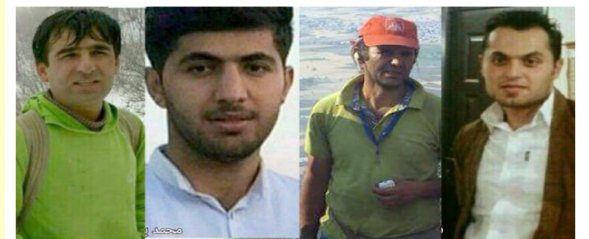
به نقل از کولبر نیوز دو مصدوم جریان کشتار روز شنبه (۳ شهریور/۲۵ اگوست) جنگلهای سلسی نابین شدهاند.