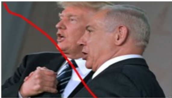
دو پناه خوری در آمریکا و اسرائیل روز مباحثات در تهران از تشکیل یک کمیته مشترک توسط دوستانه‌ای دو کشور برای افزایش فشار از داخل حکومت جمهوری اسلامی خبر دادند.

وای به روز آن دسته از مردم مستاصلی که برای رهای از چنگ یک نظام جانی و فاسد به دیگر اعضای سیاسی همان خانواده و طبقه ضد آزادیخواهی در قالب "حکومت آمریکا و غرب" و یک مشت "اپوزسیون" و عناصر پناه میبهرند که جز دفاع از سرمایه داری و استبداد، جز حقه بازی و دروغ، جز ریاکاری و دو دوزه بازی و جز فساد و سرسپردگی و مزدوری هیچ پرونده مثبتی در چنته ندارند! اینها آلترناتیو نیستند! خود مجرم و بخشی از پیکره نظام ظالمانه طبقه حاکمه اند!