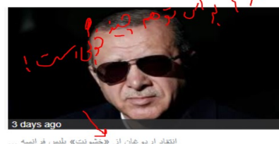
انتقاد اردوغان از «خشونت» پلیس فرانسه ... 3 days ago