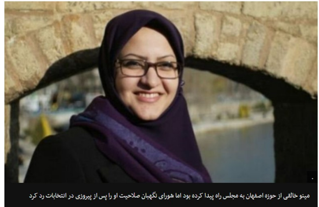
مینو خالقی از حوزه اصفهان به مجلس راه پیدا کرده بود اما شورای نگهبان صلاحیت او را پس از پیروزی در انتخابات رد کرد