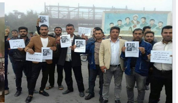
پروستاران گرج اعتراض به حقوق معوقه