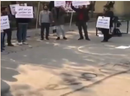
فرید "صدای هر کارگر مرگ بر بنسکر" در همدهین روز اعتصاب کارگران گروه ملی صنعتی فولاد و چهاردهمین روز تجمع در مقابل مراکز دولتی و خیابانهای شهر اهواز سه شنبه ۴ آذر ۹۷ اتحادیه آزاد کارگران ایران