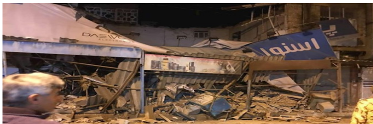
آسیب دیدگان "زلزله" دوباره به کمکهای انسانی شهروندان نیاز مبرم دارند!