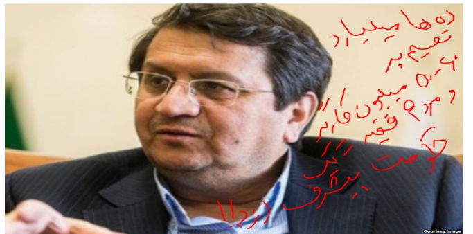
عبدالناصر همتی، رئیس کل بانک مرکزی

رئیس کمیسیون اقتصادی مجلس از «ناپدید شدن» حدود ۳.۵ میلیارد دلار منبع ارزی خبر داد