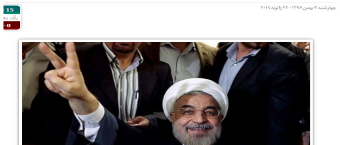
۱۵ رای ده -۰

دورویی در صحبتهای حسن روحانی: از اجباری کردن حجاب تا انتقاد از چماق حجاب بر سر زنان - ویدیو