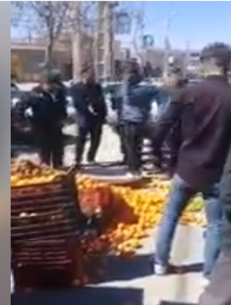
حمله مأمورین شهرداری و نیروی انتظامی به بساط یک دستفروش در اسلام آباد عرب چهارشنبه ۲۲ اسفند ۹۷

دوباره یورش لمپنهای شهردار ی به دستفرو شان!